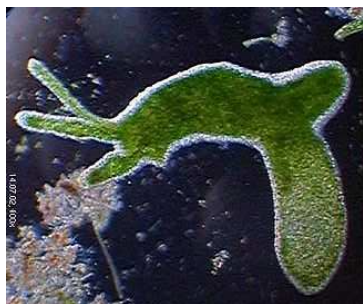
Nezmar zelený- polypovci