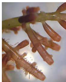
Červené řasy- ruduchy