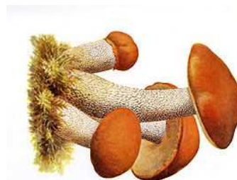
Houba s plodnicí- křemenáč osikový