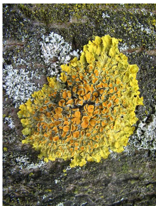
Lišejník- terčovník zední