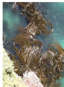
Hnědé řasy- chaluhy