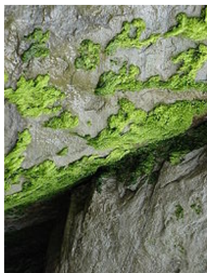
Zelené řasy- chlorofyta